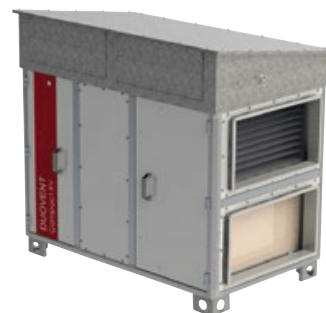
Příklad nástřešního provedení ROOFPACK-A