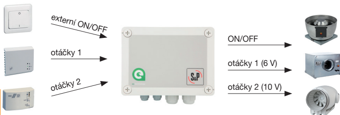
zjednodušený princip funkce regulátoru