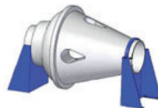
konzole pro horizontální montáž

Materiál skříně a kola lze volit v uvedeném rozsahu podle potřeby konkrétního projektu a je třeba jej uvést ve specifikaci ventilátoru.